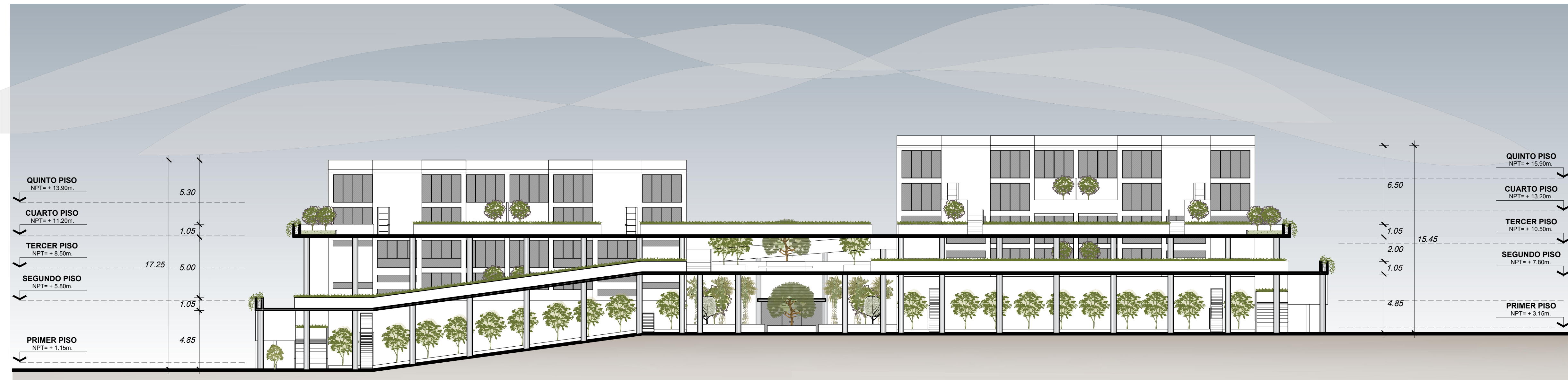
CORTE LONGITUDINAL C-C PROYECTO DE VIVIENDA TALLER Esc. 1/200