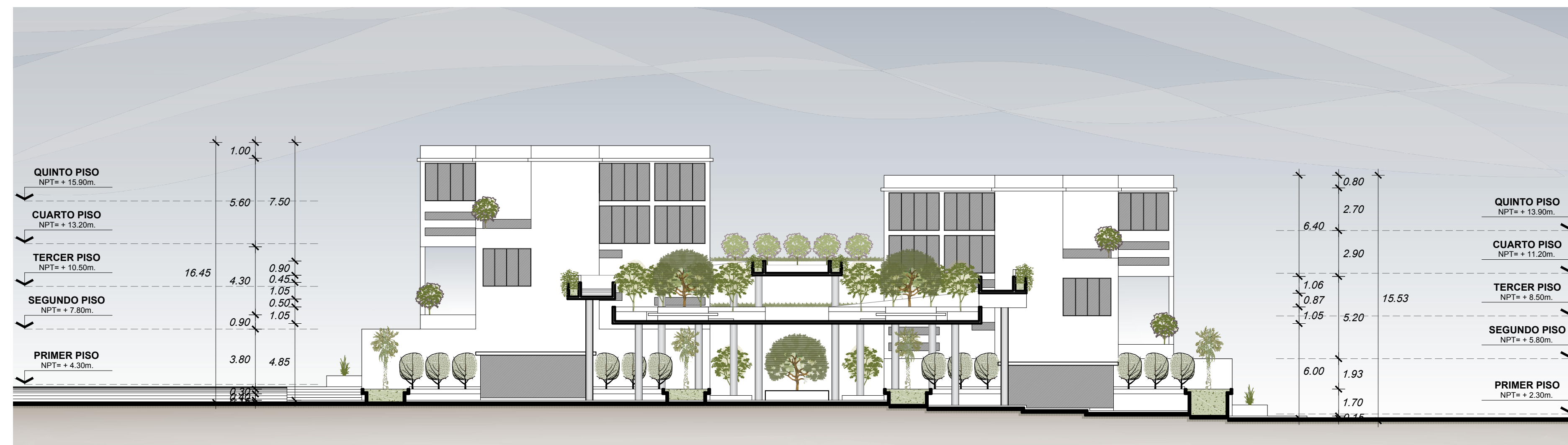
CORTE LONGITUDINAL D-D PROYECTO DE VIVIENDA TALLER Esc. 1/200